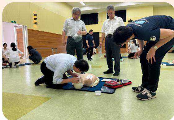
気道確保したら人口呼吸！ なかなか上手く空気を入れることが できません…