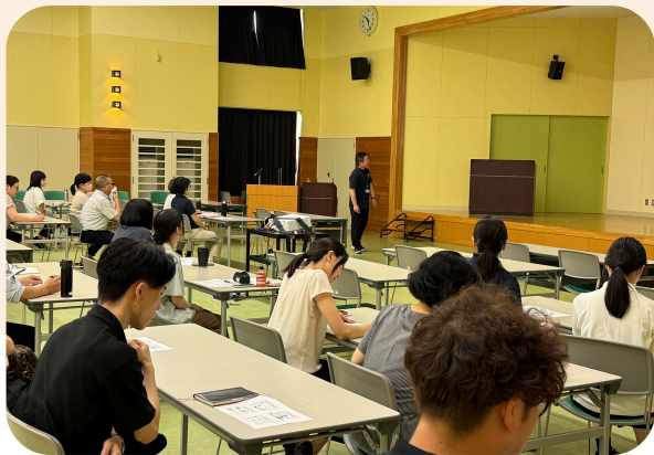
参加者のみなさん 真剣に話をまいています