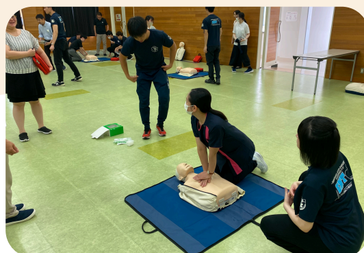
学生に教えてもらいながら 胸骨圧迫中