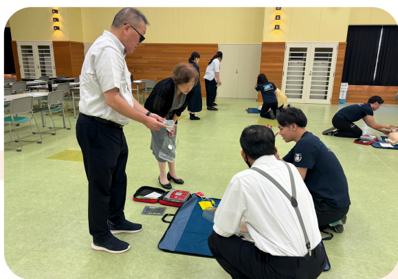
AEDの取扱いや人工呼吸の指導を受けています なんだかドキドキしてきました